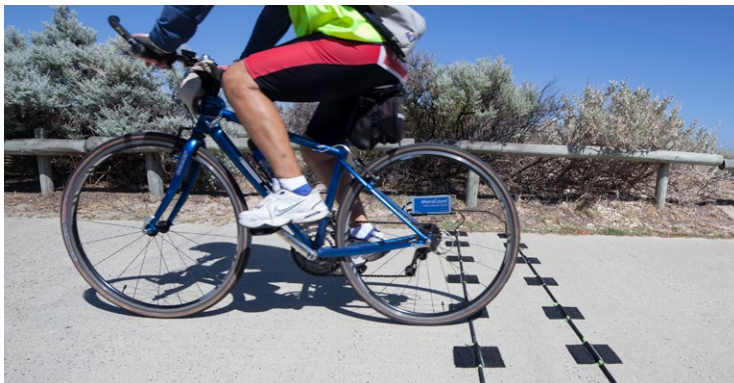
El RidePod BT registrando bicicleta sobre una ruta para bicicletas.