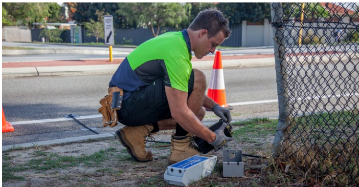
La instalación del RidePod BT es simple y rápida.